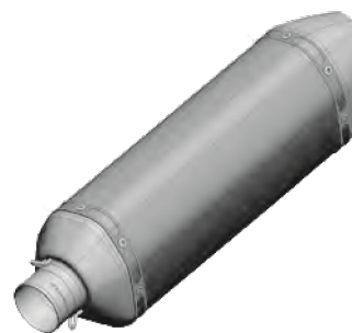
POSITION DER SERIENNUMMER