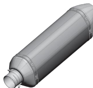
POSITION DER SERIENNUMMER